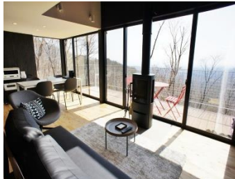
リビング&ダイニング（01棟）