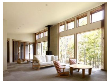
リビング&ダイニング（03棟）