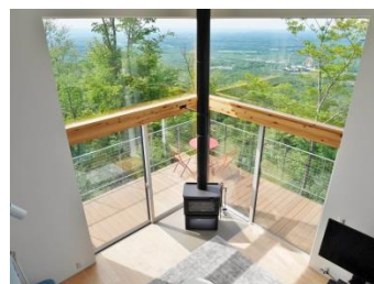
リビング&ダイニング（02棟）