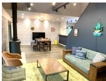
リビング&ダイニング（A棟）