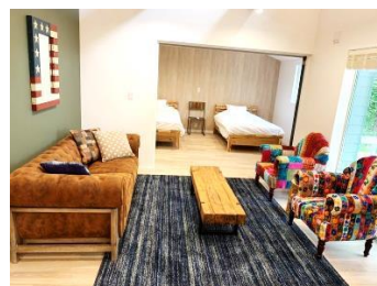
リビング&ダイニング（B棟）

今夏よりオープンした「カリフォルニアヴィラ」は、青と白を基調とした爽やかな色合いの建物で、インテリアにはラグジュアリーな家具やサーフボード等を配置し、カリフォルニアの海を連想させる新コンセプトの貸別荘です。那須の緑溢れる雄大な自然の中に居ながらも、カリフォルニアの海辺で過ごしているかのような、心地良いひと時を味わうことができます。ぜひ、大切ご家族、ご友人と、ラグジュアリーな時間をお過ごし下さい。なお、本冬には同シリーズ3棟目となるC棟が完成予定です。