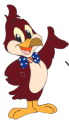
公式キャラクター 「ワービー」